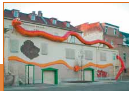
Rückansicht des Vereinsgebäudes am Henriettenpark

Der Regenwurm hat immer den Bezug zur Erde, um den seelisch kranke Menschen oft kämpfen müssen.