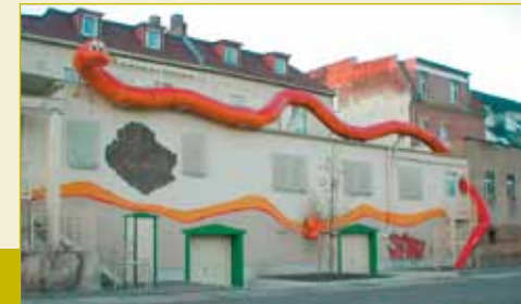
Rückansicht des Vereinsgebäudes am Henriettenpark

Der Regenwurm hat immer den Bezug zur Erde, um den seelisch kranke Menschen oft kämpfen müssen.